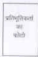
प्रतिभूतिकर्ता का फोटो