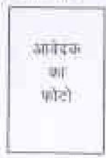
आवेदक का फोटो